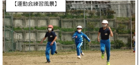
競技も全力！そして、集団行動も身につけます。