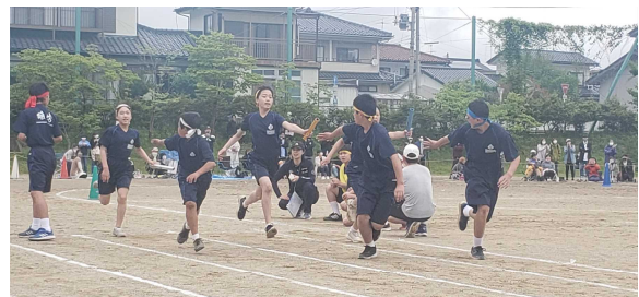
紅白スーパーリレー（4～6年）

大会スローガンにあるように、子どもたちは勇気を力に全力で競い、全力で応援をしました。そして、5・6年生の係児童も一生懸命活動をしました。結果は、「510対492」で「紅組」の勝ちとなりました。創立150周年の年にふさわしい、素晴らしい運動会でした。保護者の皆様、ご声援をありがとうございました。