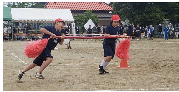
醸芳タイフーン（3・4年）