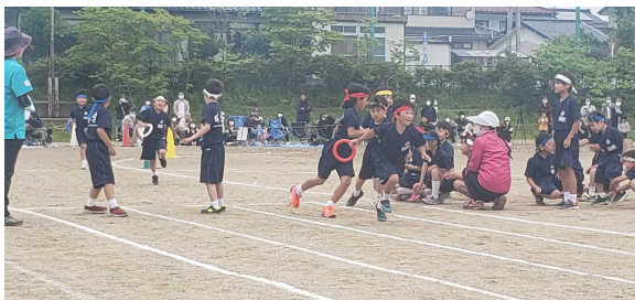
紅白リレージュニア（1～3年）