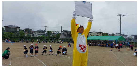
じゃんけんマンとじゃんけんぼん（2年）