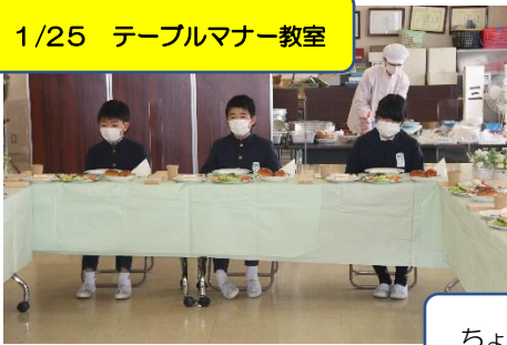
1/25 テーブルマナー教室