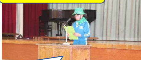
2/17 緑の少年団卒団式