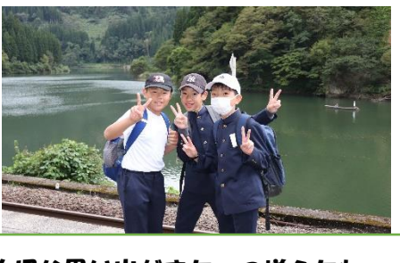
小学校生活の大切な思い出がまた一つ増えたね。