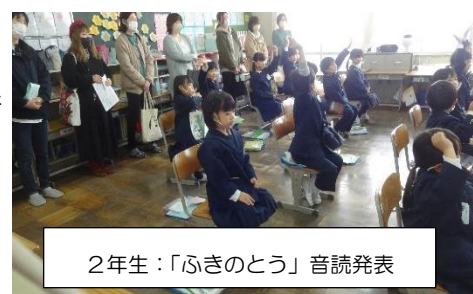
2年生：「ふきのとう」音読発表