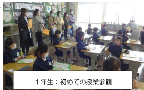
1年生：初めての授業参観

昨年度に引き続きコロナウイルスの感染拡大状況を見極めながらの活動となりますが，PTA をはじめ地域の方々からもご意見をいただきながら，半田醸芳小学校と半田地区のよさを活かした学校づくりに努めて参ります。