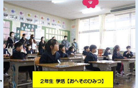
2年生 学活【おへそのひみつ】

次年度も教職員一丸となって、学習指導はもちろん、各種教育活動の充実に向けて参ります。ご理解とご協力のほど、よろしくお願いいたします。