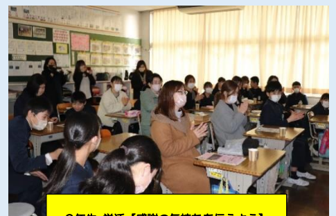
6年生 学活【感謝の気持ちを伝えよう】